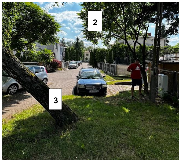
Rysunek 2 lokalizacja ZK PGE