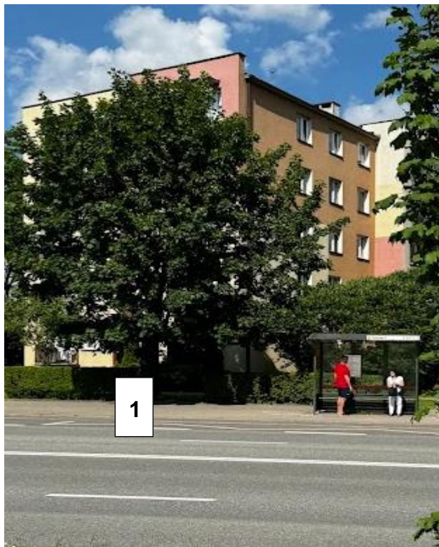
Rysunek 1 Przystanek MZK „Zamkowa 2” w stronę północną