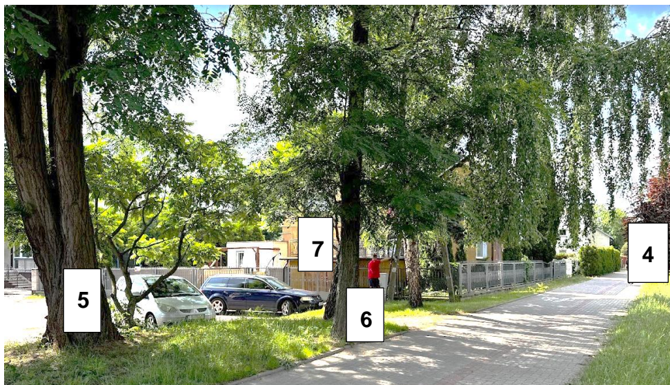
Rysunek 3 Lokalizacja ZK PGE